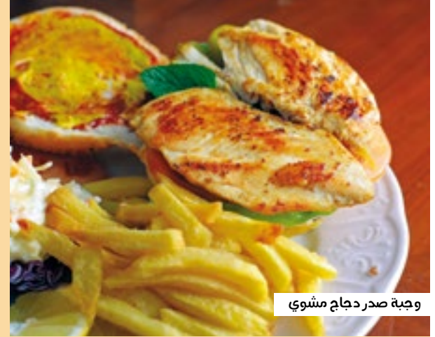
وجبة صدر دجاج مشوي